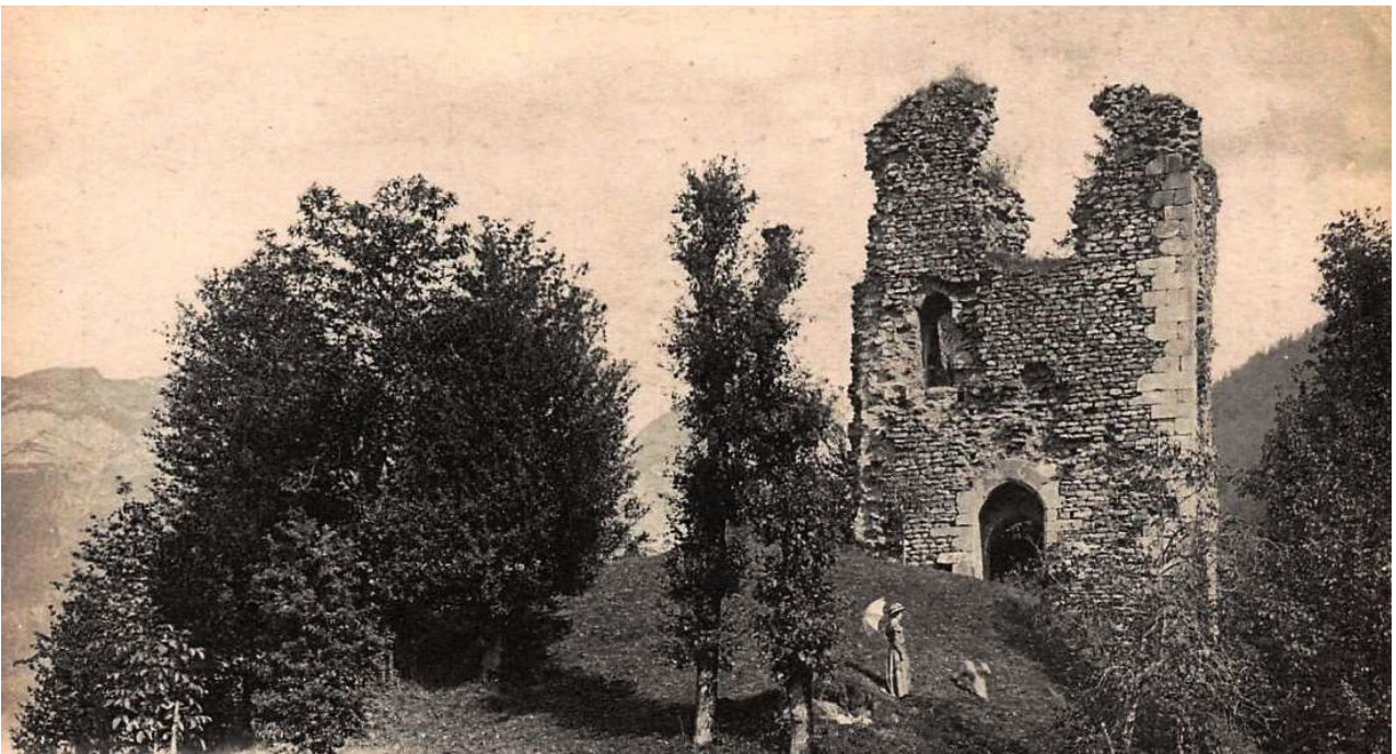
Ruines du château féodal d'Ugine