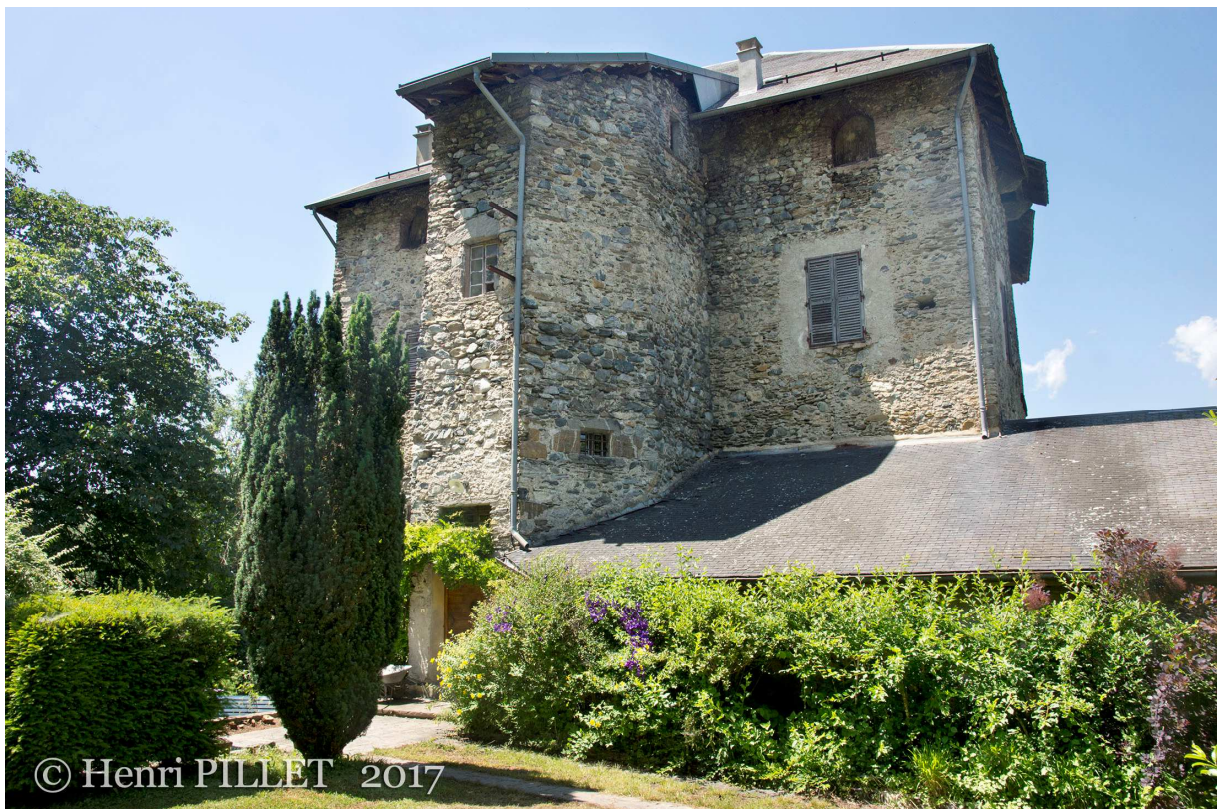
La maison forte de Villard-Dizier, demeure ordinaire des Nobles de Gallis