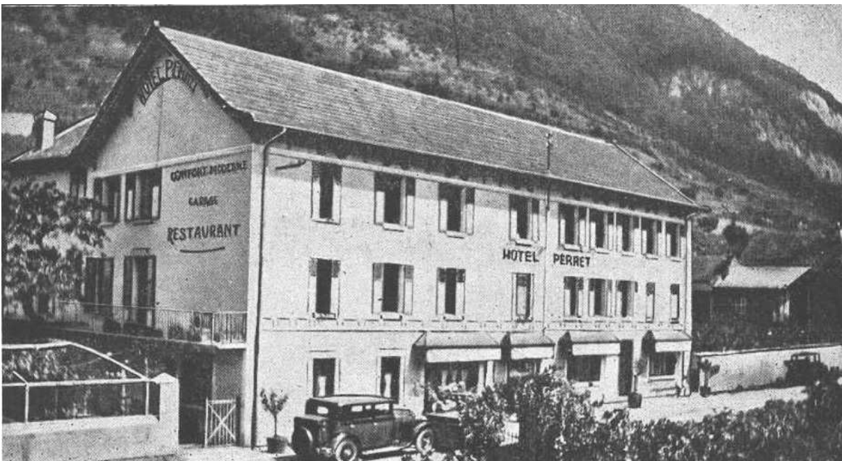
Hôtel Perret à Aigueblanche

Les Perret d'Aigueblanche et de Bellecombe sont très probablement originaires de Villargerel, où l'on trouve une famille de ce nom en 1561. Etablis à Aigueblanche au début du XVII e siècle, ils se sont distingués au plan local pour avoir été une florissante lignée de maréchaux et de forgerons. À la fin du XIX e siècle et durant tout le siècle suivant, leur nom s'est illustré d'une autre manière, grâce à un hôtel renommé, bien situé à la sortie de la ville, au bord de l'ancienne grande voie qui conduisait à Moûtiers.